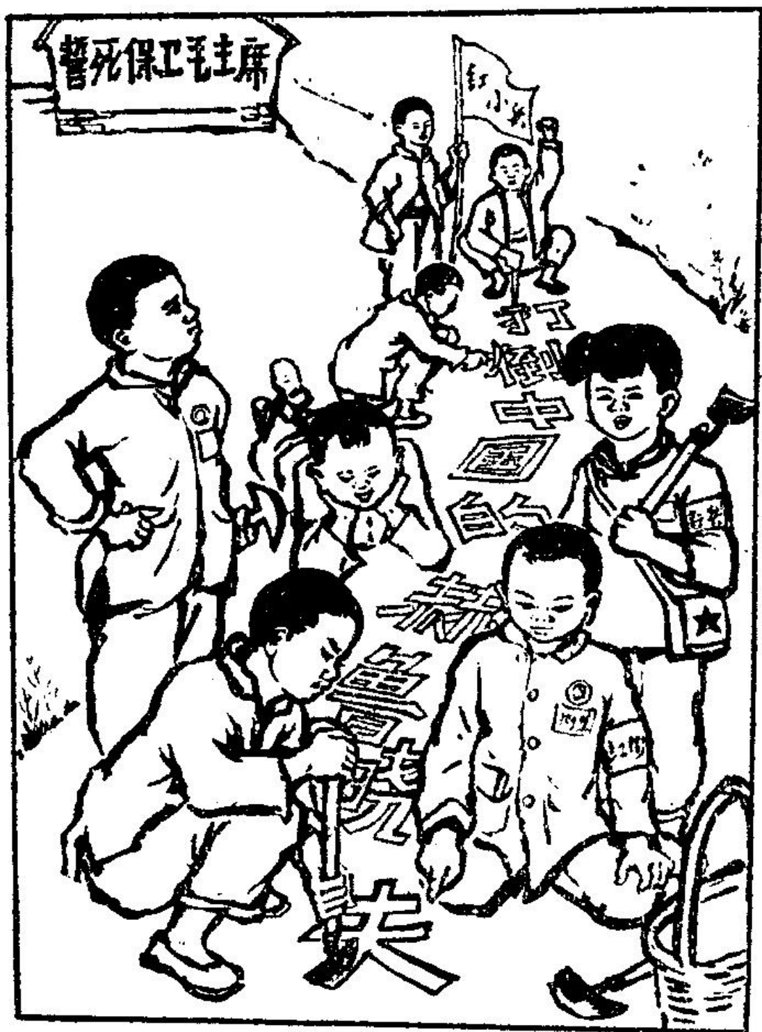
韩村的儿童积极投入无产阶级文化大革命，他们正在路上刻写大标语。